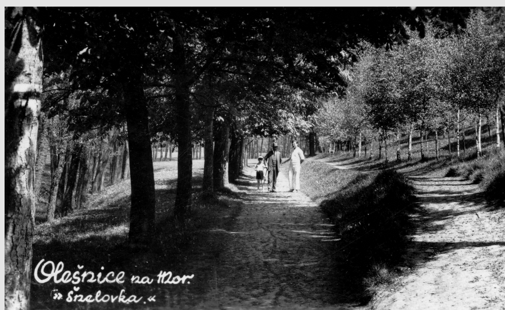
foto: Olešnice na fotografii, 1939

Aleje se vysazovaly už ve starověku, byly významným nosným prvkem české barokní krajiny. Z mnohých se těšíme teprve my, kteří nepamatujeme ty, kteří je vysázeli. Obnovujeme staré aleje a sázíme nové v dostatečné míře a s citem pro krajinu?